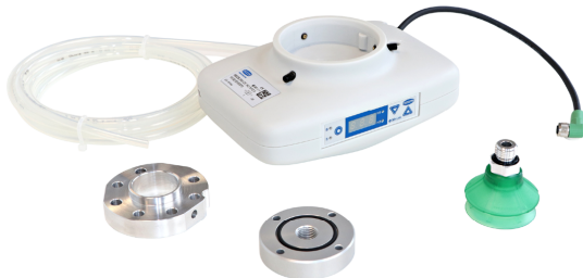
Sets de manipulación RECB

Capacidad de aspiración de hasta 57,2 l/min