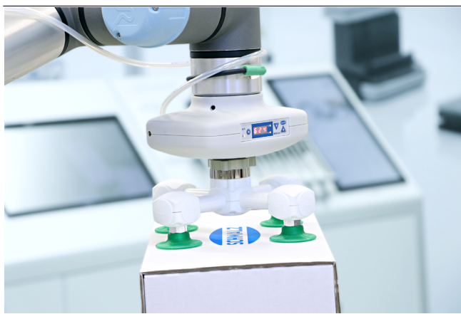
Generador de vacío neumático RECB para la manipulación de cajas de cartón